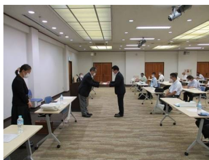
令和3年適正処理推進委員委嘱式