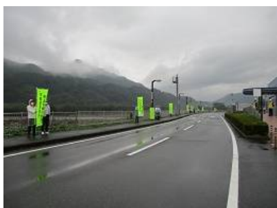
協力いただいた協会員

実施日時 令和3年10月12日(火) Am9:30～正午 実施場所 国道17号 下り線 月夜野情報ターミナル駐車場 協会参加者 19名