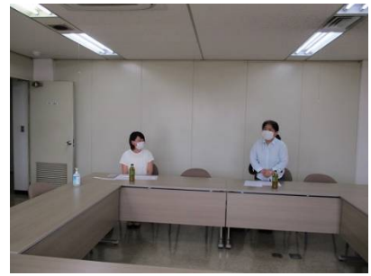
女性部会会合の様子