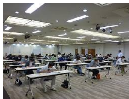
令和2年度暫定講習会