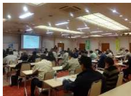
(県共催) 4ブロック研修会