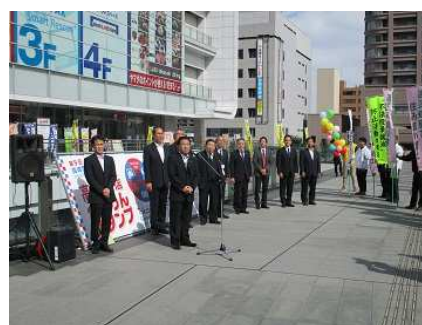
(県共催) 不適正処理防止啓発県民の集い