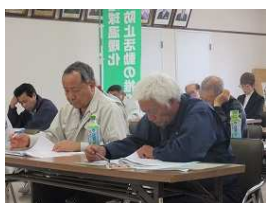
伊勢崎支部研修会

各支部組織による研修会は総会に先駆け研修会を開催。 講師派遣は、行政機関・協会長による廃棄物処理法関連をテーマに基調 講演多くの支部会員は最近の処理法に関する学習を学び、意義ある研修会 開催を収めた。