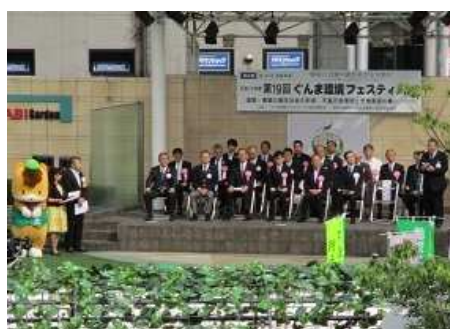
ぐんま環境フェスティバル